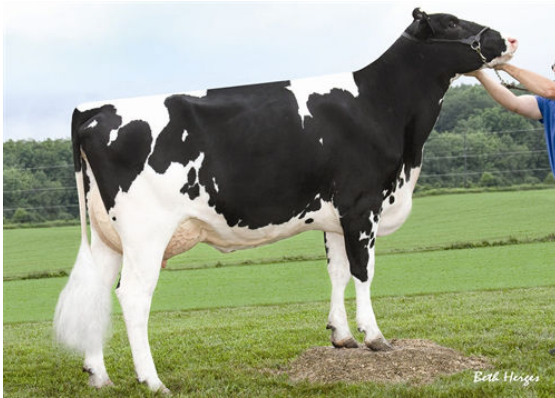
LARCREST CINNAMON GRANDDAM